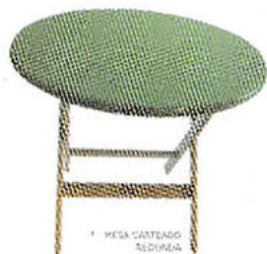
MESA CARTEADO SOLTEIRA