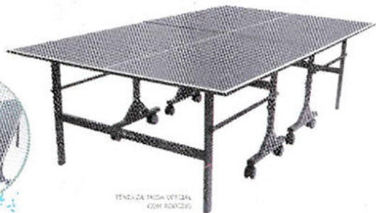
TENIS DE MESA 4000 4000220

AS MELHORES OPÇÕES EM ESPORTES E LAZER PARA TODAS AS IDADES.