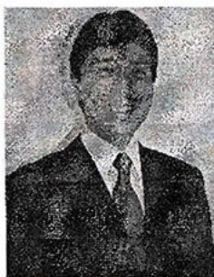
Hélio Nishimoto Deputado Estadual - PSDB

Por esse motivo eu não poderia deixar de oferecer o meu apoio aos Organizadores e Participantes desta Competição e desejar muita alegria e sucesso.