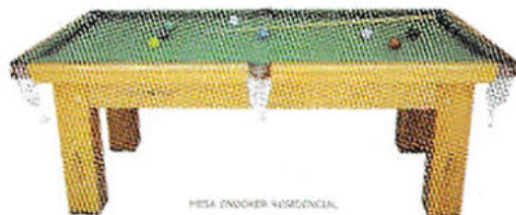
MESA SNOKER 40000000