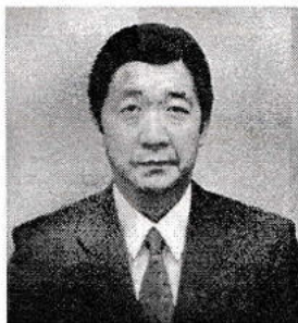
Ministro KEIJI YAMAMOTO Encarregado de Negócios ad interim Embaixada do Japão no Brasil

Por fim, quero manifestar meu apreço pela Associação Cultural e Esportiva Piratininga e pela Associação Até a Vista, que uniram esforços para a realização desta competição.