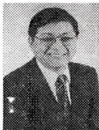
Pedro Komura Vereador - Mogi das Cruzes